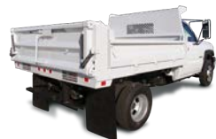
HEAVY DROP SIDE CONTRACTOR