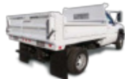
HEAVY DROP SIDE CONTRACTOR